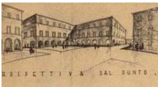
Fra le carte conservate in Archivio, i piani di ristrutturazione di piazza Garibaldi del periodo fascista. A lato, la sede dell’Archivio, nell’ala ex carceri